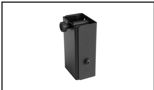
Кронштейн с регулируемым углом наклона (для установки на телескопическую стойку)